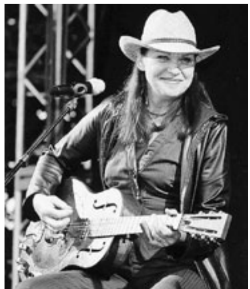
„Easy in my Soul“: Die Sängerin Inga Rumpf gastiert im Oktober in der Oytener St.-Petri-Kirche.

Die Vorverkaufsstellen in Oyten sind das Schreibwarengeschäft „Papier Meyer“ und das Kirchenbüro im Kirchweg 2, das telefonisch unter 04207 / 91140 zu erreichen ist. Die Karten können auch im Internet unter der Adresse www.domino-oyten.de/karten zum Vorverkaufspreis erworben werden.